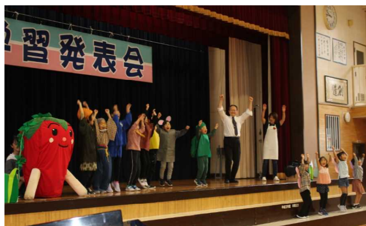
1年音読劇 大きないちごが抜けて大喜び