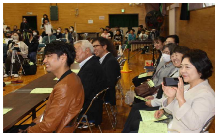
来賓の皆さんも笑顔