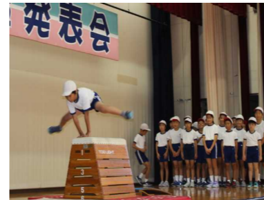
4年身体表現 跳び箱