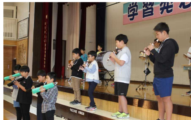
5年音楽 ルパン三世