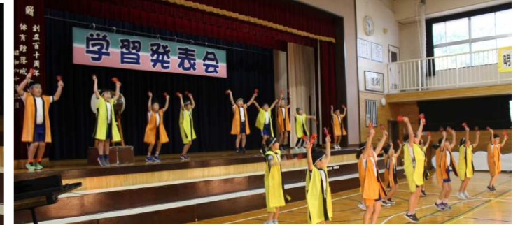
2年表現 よさこいソーラン