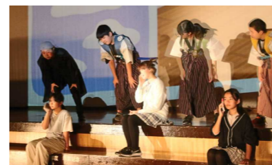
6年劇 雲の上の三武将