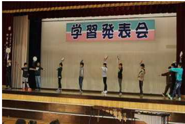
3年音楽 タンブリン：リズム遊び