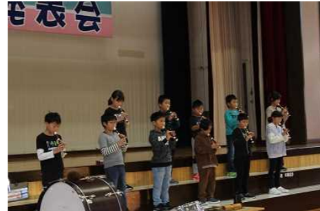
3年音楽 あの雲のように