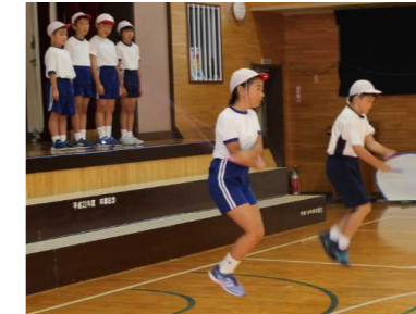
4年身体表現 縄跳び