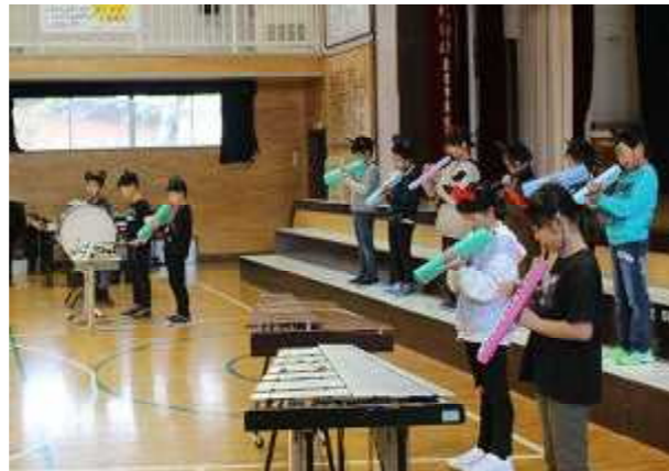
3年音楽 ミッキーマウスマーチ