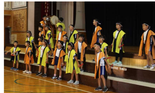
2年表現 村まつり（歌） お祭り（群読）