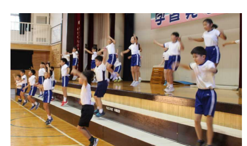
4年身体表現 ダンスホール