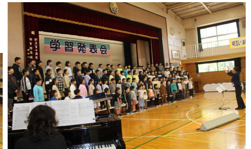
4年ぶりの全校合唱 「夢の世界を」「宝島」