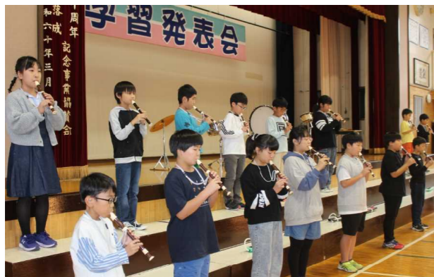
5年音楽 茶色のこびん ハロー・シャイニング・ブルー